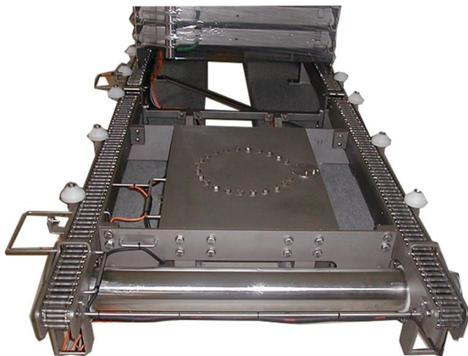
TABLE TOURNANTE MANUELLE Type RRSC Pour chargement des tunnels Rotation manuelle de 90° à 180° En complément de convoyeur RSC Energie nécessaire : air comprimé pour le levage