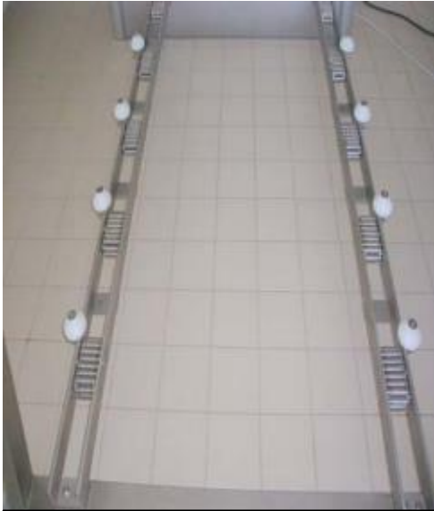
CONVEYOR Type RSC Adaptability to any width No energy consumption