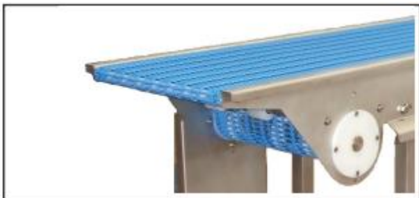
Sabre en entrée / Sabre en sortie