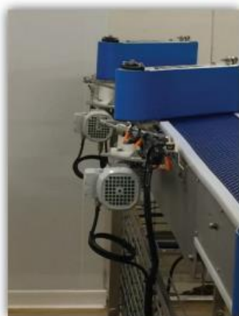
- Motorised sling