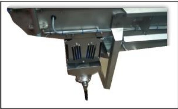
- Retention bin