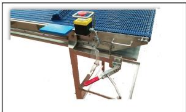
- Avec verouillage - Avec support de bac