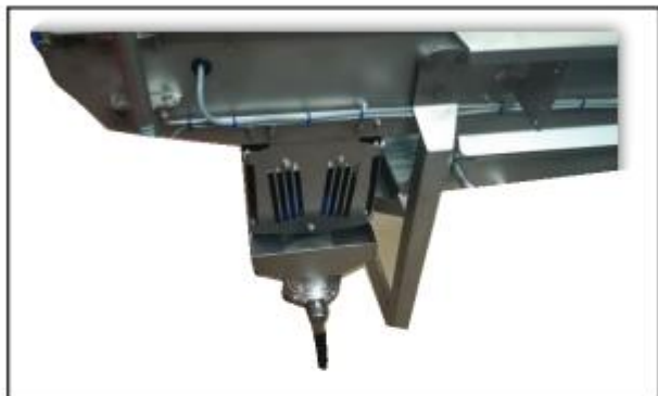
- Bac de rétention