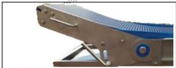
- Hauteur de nez réglable