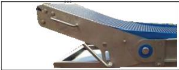
- Adjustable nose height