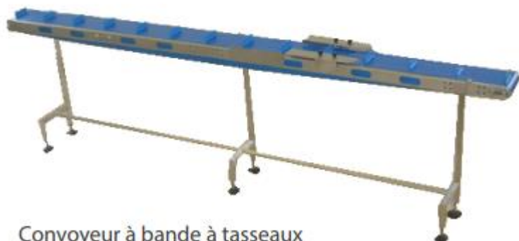
Convoyeur à bande à tasseaux