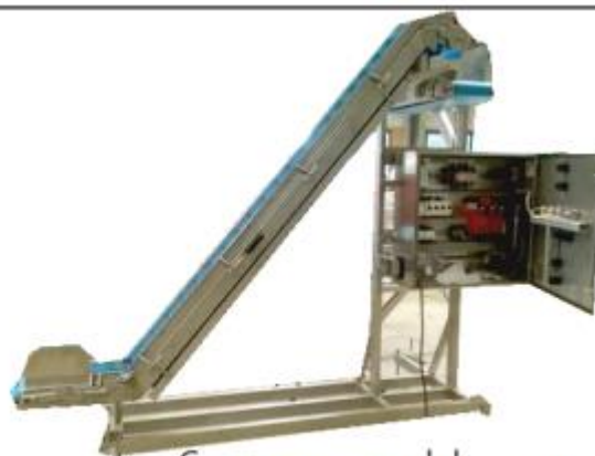
Convoyeur en col de cygne