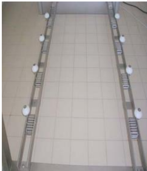
CONVOYEUR Type RSC Adaptabilité à toute largeur Pas de consommation d'énergie